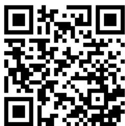
公式ホームページ