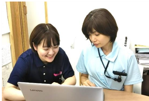
管理者&主任ともに高知県出身