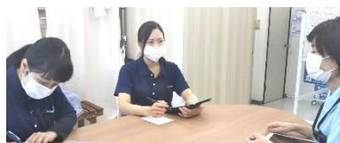
新人を交えてのカンファレンス風景

いう想いを支え、頼られる相談役になれるように頑張りますので、何卒よろしくお願いいたします。